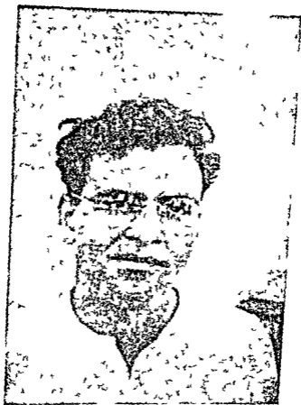
चौधरी शेर जंग